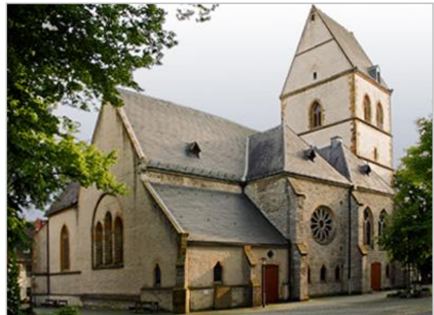
Die St. Johanniskirche in Halle.

Das Interesse der kirchlichen Lehrer – zumeist Kantoren, die den Dienst des Küsters und des Organisten versahen und sich in der Schule ein Zubrot verdienten (was sie auch nötig hatten) – lag natürlich vor allem in der Vermittlung von christlicher Lehre. Biblische Texte, Liedtexte und Psalmen mussten die Schüler auswendig lernen und erläutern. Es wurde montags abgefragt, worüber der Pastor sonntags gepredigt hatte.