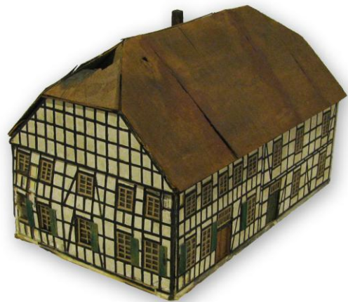
Modell der neuen Schule im „Groppe-Haus“.